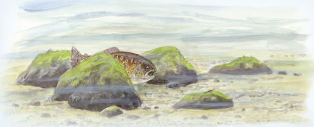
Sten giver skjul og læ for fisk og smådyr