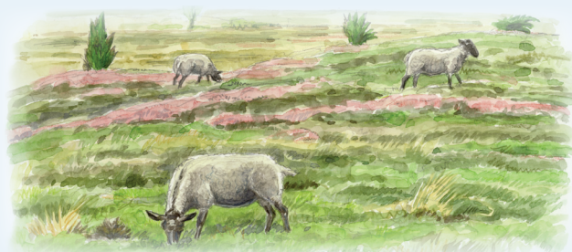
Får der afgræsser heden

Funder Å har et stort fald og er et af de vandløb i Danmark, som har den hurtigste strøm. Fra bakkerne løber mange kilder til, og vandløbet bliver hurtigt til en rigtig å.