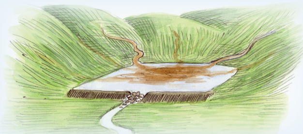
Etableret okker sø